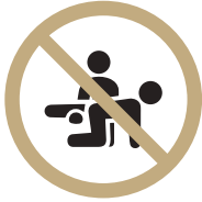
외부인 강습 불가