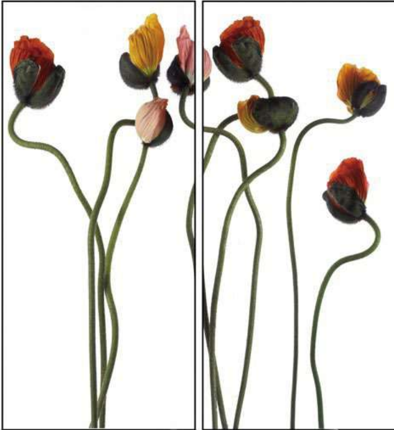
Bill Beckley, Oh to Be Young Carefree and Gay, Epilogue 1, 2006, cibachrome photo, 196 x 88 cm (2 pcs)

기간 2026년 6월 3일 (수) - 7월 6일 (월) | 장소 클럽동 로비 | 문의 02 2250 8084, 8085