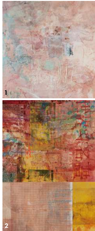
1 화이트 그라운드(배신당한), 2023, Acrylic on canvas with collaged studio debris, 235×225×4.5cm. 2 '세계의 명화(발화)', 2026, Oil and acrylic on canvas and linen with collaged and silkscreened elements, 210×150×4.5cm

한 것, 세속적인 것은 평소 자주 생각하는 주제이며, 특히 기독교와 불교의 도상학이 죽음과의 관계를 서로 다르게 묘사하는 것을 발견할 때면 더더욱 그러하다. 또한 여러 종교 사원과 고대 아스텍 건축물의 웅장함을 탐구하여 작품 배치에 참고했다. (이스라엘이 가자 지구를 공격한) 2023년 10월 이후 나의 색채 팔레트는 근원적으로 변화했다. 동양에서 죽음을 다루는 방식과 땅자를 위한 의식을 파고들기 시작했다.